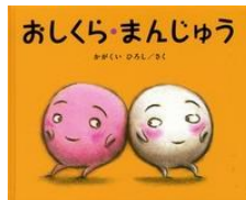
「おしくらまんじゅう」 作・絵 かがくいひろし ブロンズ新社